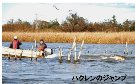
ハクレンのジャンプ