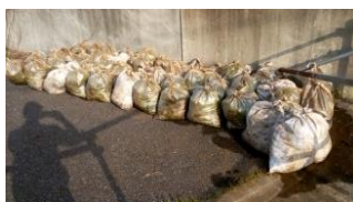
集積オオカワヂシャ