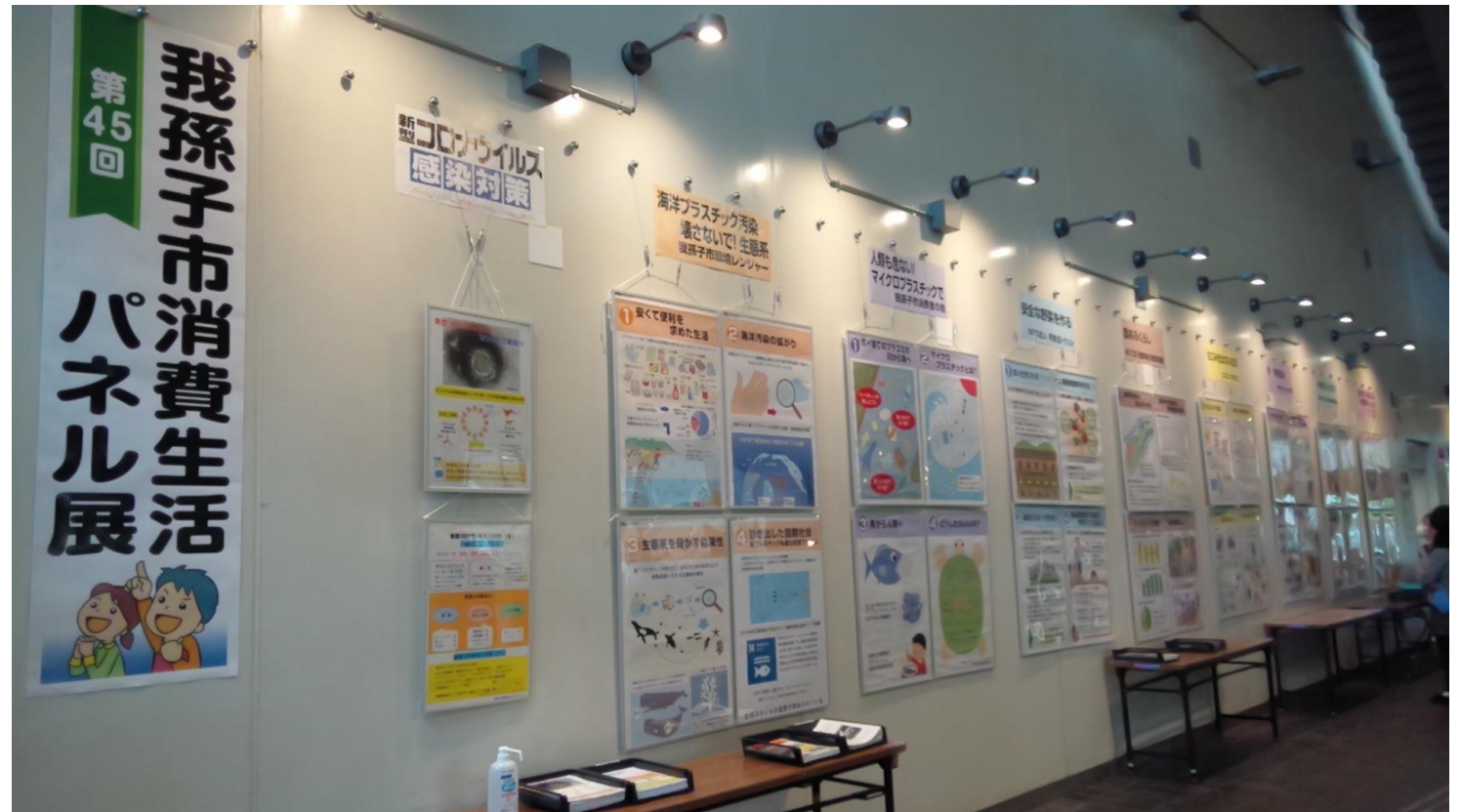
アビスタストリート