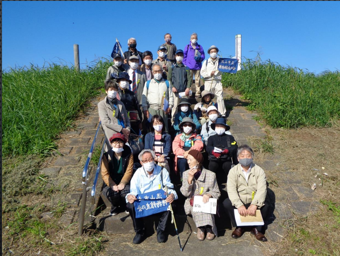
江戸川の土手にて