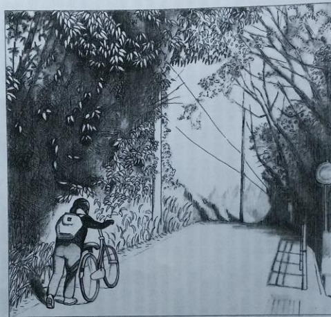
天々崎の坂 画・岡村純好