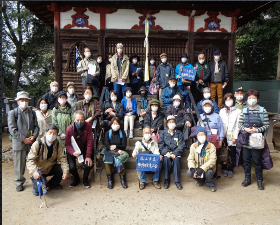
観音堂(高梨家墓地)の前で