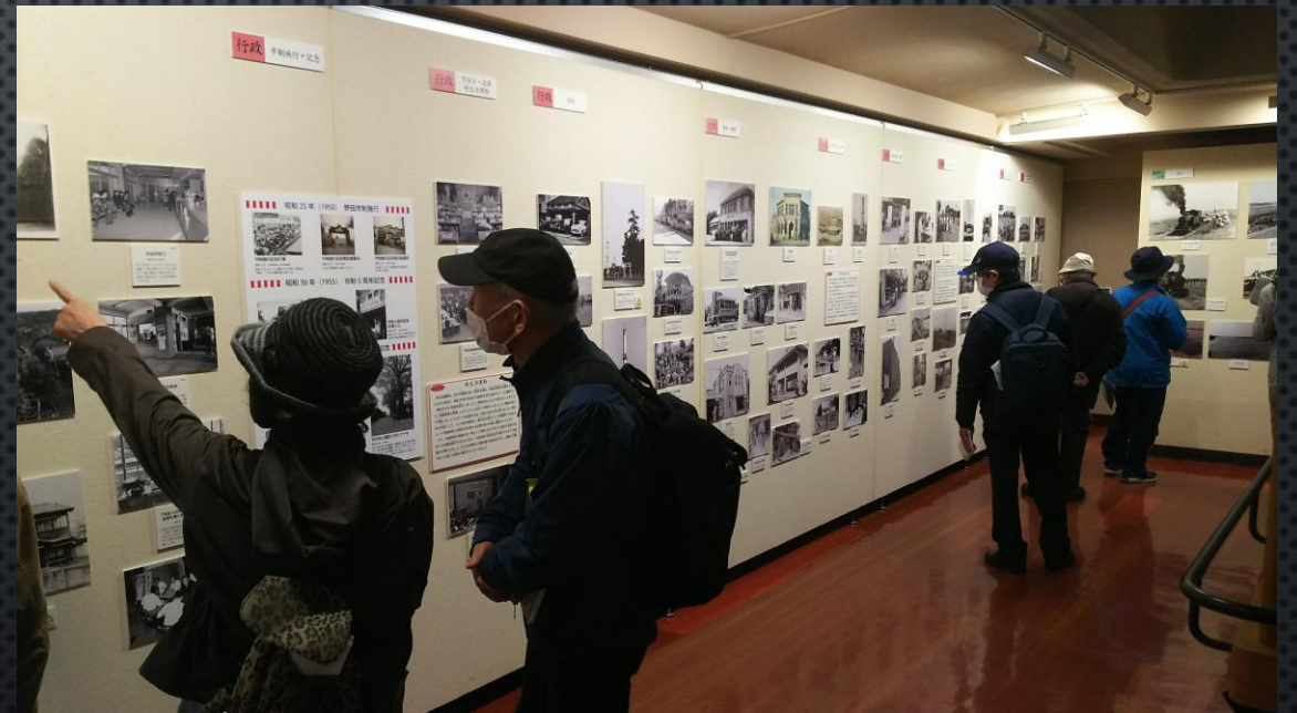
野田市郷土博物館内の見学様子