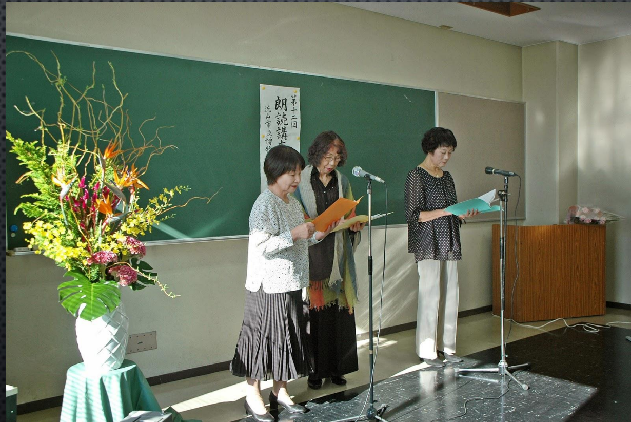
谷川俊太郎の「朝」を朗読