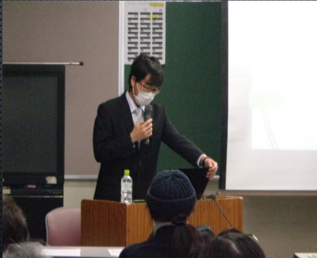
PPT沿って野間土手について語る講師