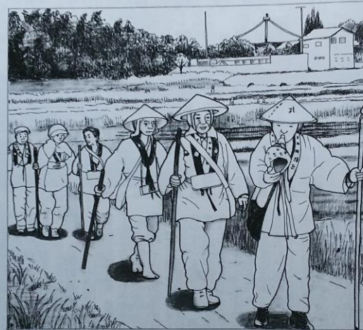
東葛印齋大師講 画・岡村純好