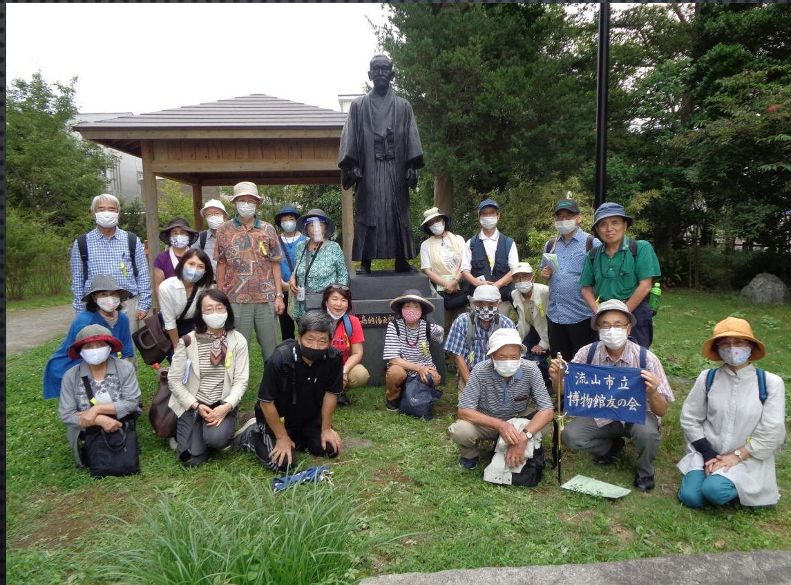
嘉納治五郎像の前で